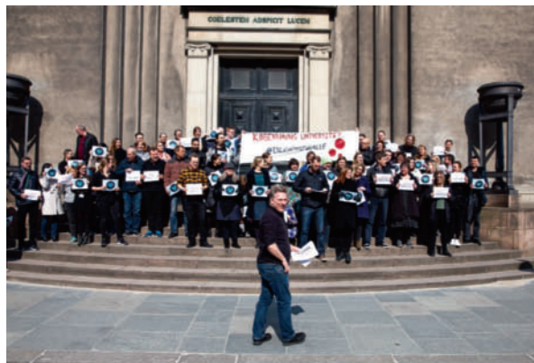
Kampen om den offentlige opinion foregik i høj grad på de sociale medier - blandt andet med aktionen 5 i 12, hvor offentligt ansatte uploadede fotos til sociale medier - her KU's ansatte.