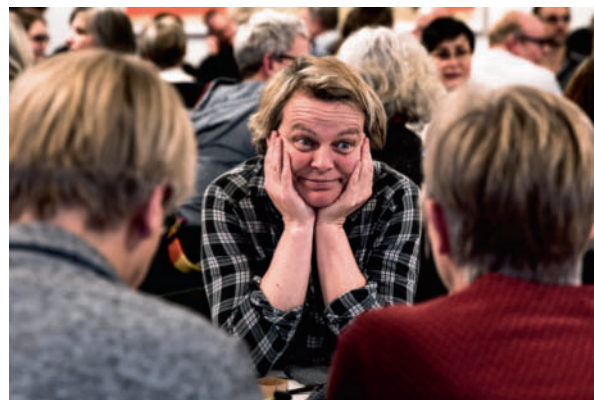
“Kan vi miste mere på konflikten, end vi nogensinde kan vinde ved en aftale?” lød et spørgsmål til et af DM's første arbejds- pladsmøder i Haderslev.