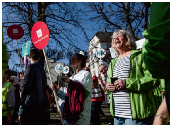
Jo mere udmattede forhandlerne blev i forligsmandens kløer, des mere energi fik demonstranterne ude foran.